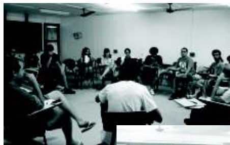
Reunião Preparatória do SENUP 2011: Florianópolis, 4 e 5 de Dezembro de 2010