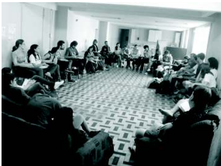
Reunião Preparatória do SENUP 2011: Porto Alegre, 19 e 20 de Março de 2011

Sistematizar referenciais teóricos para a elaboração de um programa de Universidade Popular e seus meios de implementação.